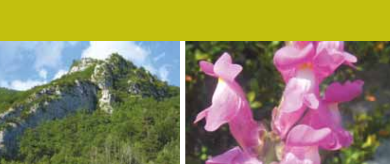
Cingles de Maiols / Pau Ortiz