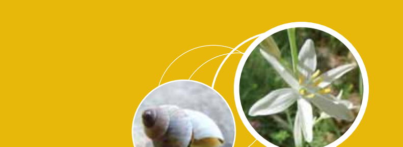
Caragola i Lliri de Sant Bru Pau Ortiz