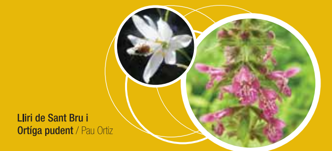
Lliri de Sant Bru i Ortiga pudent / Pau Ortíz

Text i il·lustració: Centre d'Educació Ambiental Alt Ter. www.alt-ter.org Agraïm la col·laboració al G.E.C (Centre Excursionista de Campdevànol).