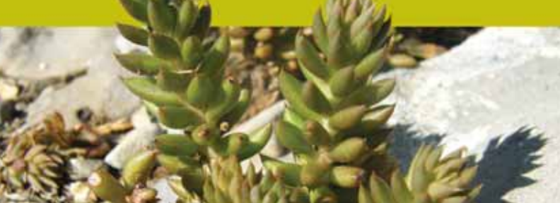
Crespinell / Pau Ortiz

6. Punt de referència: Collet dels Graus Distància: 3.750 m - Temps: 1:30 - Altura msnm: 1.172 m Descripció: El collet dels Graus és un pas natural entre la vall de Sant Martí i la vall de Maiols i Saltor, que allora esdevé un mirador excepcional vers ponent, amb la vall del Merdàs al davant mateix i els Rasos de Tubau i la muntanya del Pedraforca com a teló de fons. Al fons de la vall podem observar la colònia Molinou, d'on venim, i a la seva dreta, dalt d'un turó, l'ermita de Sant Grau. Ens dirigim cap a l'esquerra en direcció als cingles