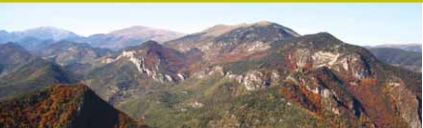
Serra de Montgrony