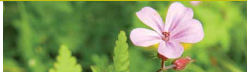
Herba de Sant Robert / Pau Ortíz

Text i il·lustració: Centre d'Educació Ambiental Alt Ter. www.alt-ter.org Agraïm la col·laboració al G.E.C (Centre Excursionista de Campdevànol).