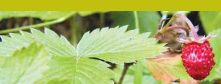
Maduixera / Pau Ortiz

16. Punt de referència: Pas del Cargol Distància: 9.325 m - Temps: 3:45 - Altura msnm: 1.200 m Descripció: El pas del Cargol és un pas natural adequat des d'antic amb un mur per eixamplar el camí i esglaons per facilitar la tasca de superar la cinglera. En aquesta zona rocallosa abunden les espècies rupícoles que hem trobat al pas dels Graus, com la farigola, els gossets i els crespínells, entre altres. Al final del pas trobem una porteta de fusta que cal deixar tancada. Ara entrarem en en una roureda per sota la cinglera. Aquesta jove roureda ocupa els antics camps de conreu aterassats dels masos que formaven part de l'antiga parròquia de Sant Martí d'Armàncies, la majoria avui totalment desapareguts. El corriol baixa ràpidament entre els roures prims i un sotabosc ric de tortellatge, aranyoners, arcos blancs, argelagues i esbarzers, tots ells abundos propis del sotabosc assolellat de la roureda. El camí descendeix ràpidament tot fent ziga-zagues fins arribar a un clot més humit format per avellaners i blades; hi abunda la molsa, l'hepàtica, la lleteresa i el marxívol. Pocs metres després, el corriol passa per sobre d'una pista ampla que queda a la nostra dreta. En aquest punt cal deixar els senyals del GR i baixar fins aquesta pista.