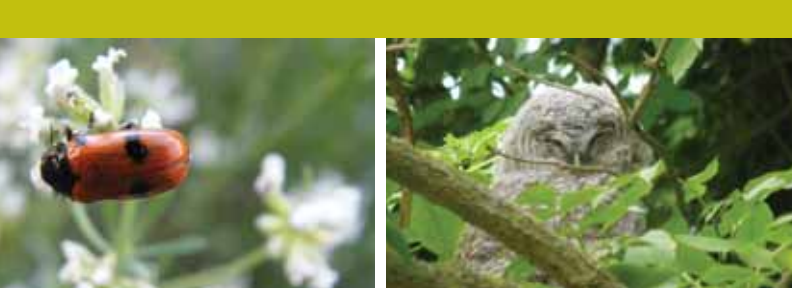
Escarbat de les fulles / Pau Ortiz

13. Punt de referència: Mirador sota Corones Distància: 7.000 m - Temps: 3:00 - Altura msnm: 1.400 m Descripció: Des d'aquest punt excepcional es gaudeix d'una de les vistes més interessants de la serra de Montgrony i la vall del Freser. Davant mateix, cap a ponent, sobre la vall del Merdàs, destaca la serralada dels Rasos de Tubau i el Catllaràs, i tancant la vall hi ha l'imponent massís del Pedraforca, amb la Serra del Cadí a la seva dreta. Una mica més a la dreta s'aixequen les muntanyes que conformen la Serra de Montgrony, amb la muntanya del Cuàs en primer terme i la Collada de Grats, al seu darrera el turó de Sant Pere amb la cinglera de Montgrony, i seguint l'eix principal de la serralada destaca el Costa Pubilla, la Covil i la Berruga. Més al nord es divisa el poble del Baell i Campelles sobre un turó, i finalment el Puig de Dòrria i el massís del Puigmal de fons. El camí continua per la pista principal dirigit-se ara cap al nord i entrant de nou dins de la fageda. Pel camí podem veure petits fajos que creixent sota mateix d'altres individus adults de la seva mateix espècies, així com moixeres de guilla, un arbre de fulles compostes i serrades i que dona