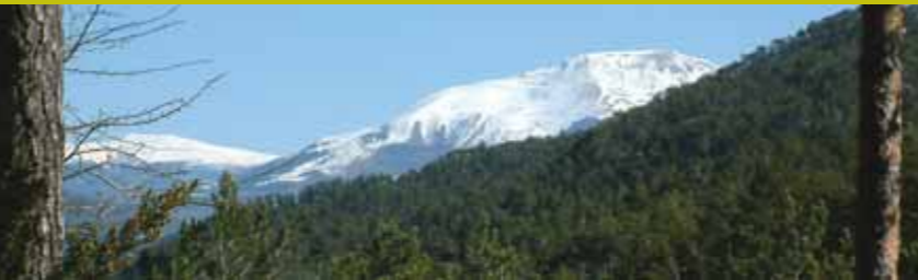
Cim del Taga des de la Vall del Torrent de la Cabana