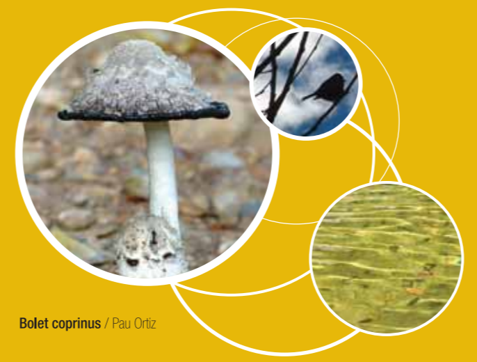
Bolet coprinus / Pau Ortiz