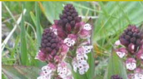
Orquídia Orchis Ustulata / Pere Masdeu