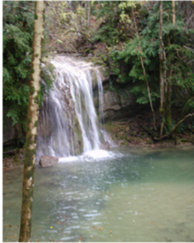
Gorga de Dalt

Cap amunt, hi ha 1Km.fins al camí de carreta de Llastanosa a la Barraca.