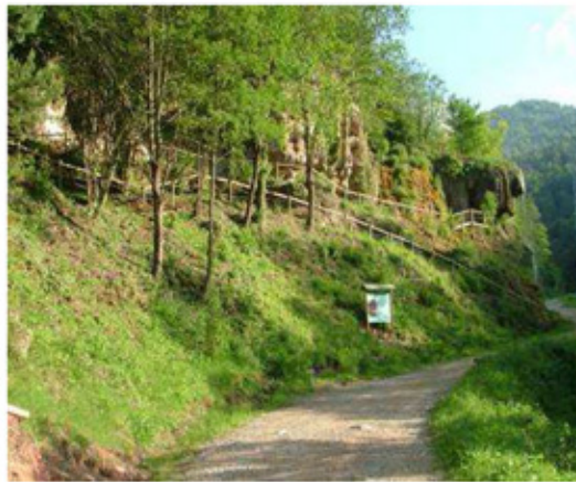
Font de la Tosca

Continuem a mà dreta en direcció al poble i trobem l'edifici Solà i Cortal i a 1Km.més, tornem a ser a la Font de la Tosca.