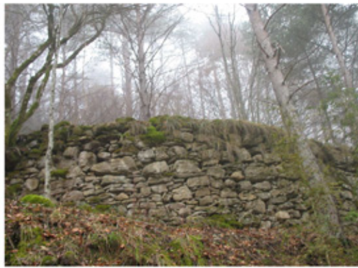
Era de batre d'en Paixana

Cap avall, seguint els punts blaus, passarem per la Gorga de Dalt i la Gorga de Baix, la bauma del Boer, una palanca i l'Era de batre d'en Paixana. A 1Km.més, arribarem a la pista que va cap a Milany.