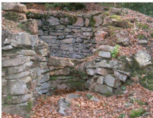
Forn de calç de Llastanosa

Creuem el Torrent de la Font del Bisbe i agafem el camí que baixa per la fajeda. Al costat dret veurem una impressionant cascada.